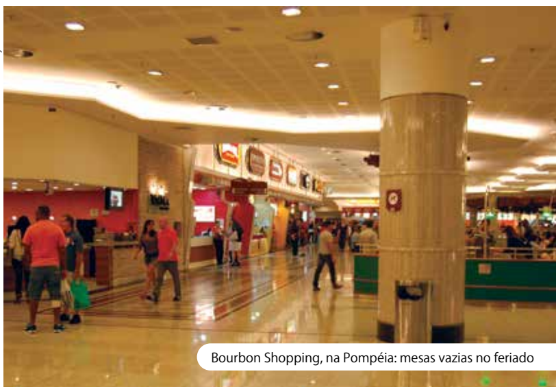
Bourbon Shopping, na Pompéia: mesas vazias no feriado

tanos. A informação faz jus ao ditado popular que afirma: “Shopping é a praia do paulistano”.