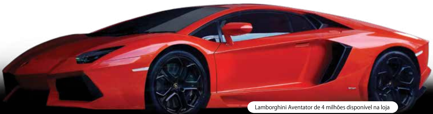
Lamborghini Aventador de 4 milhões disponível na loja

Pois é, este é só mais um dos contrastes que a cidade de São Paulo nos promove. De um lado os veículos mais luxuosos e cobiçados do mundo; do outro, uma pilha de carros sem destinos que aumenta constantemente e que ninguém mais quer.