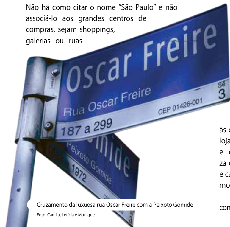
Cruzamento da luxuosa rua Oscar Freire com a Peixoto Gomide