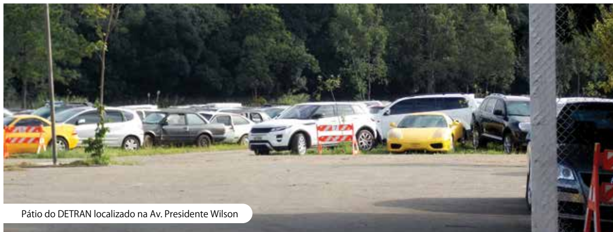
Pátio do DETRAN localizado na Av. Presidente Wilson

Agora imagine um local repleto dos carros mais cobiça-