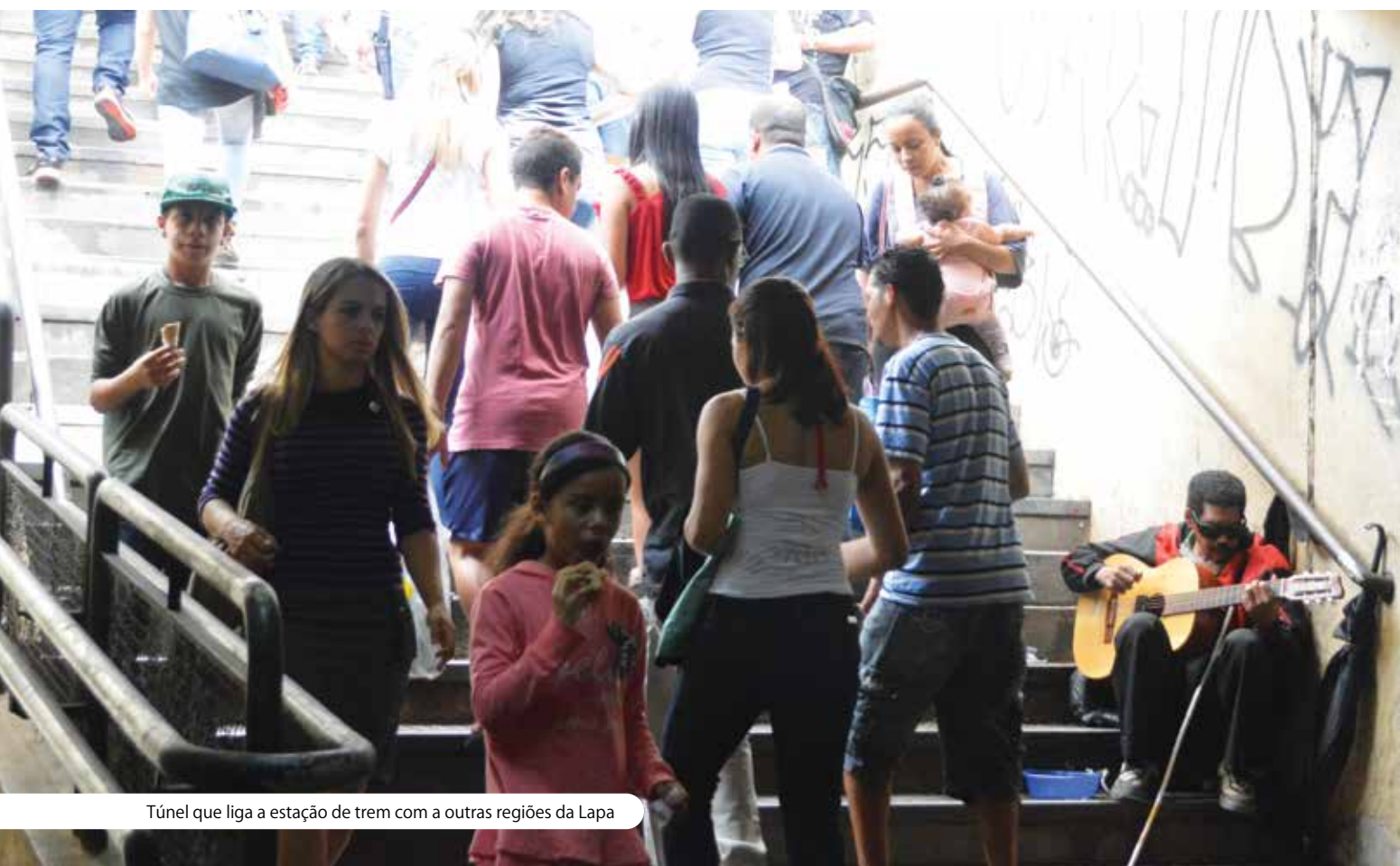
Túnel que liga a estação de trem com a outras regiões da Lapa