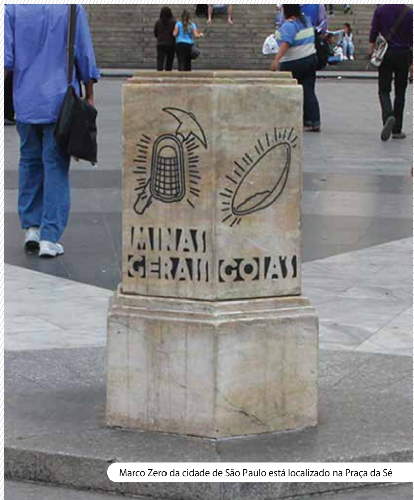
Marco Zero da cidade de São Paulo está localizado na Praça da Sé