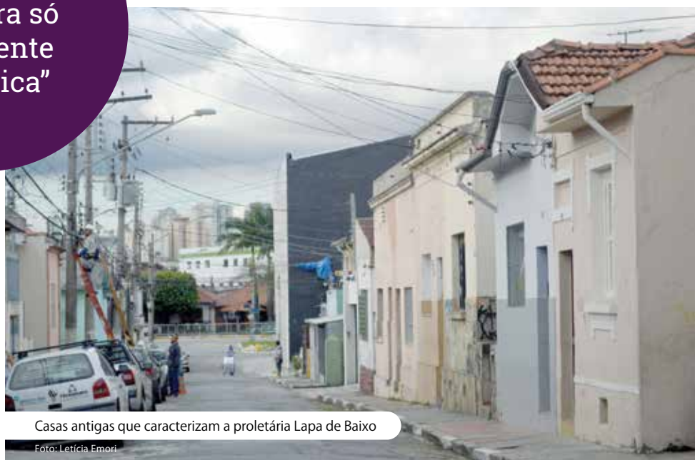
Casas antigas que caracterizam a proletária Lapa de Baixo

“O Alto da Lapa era só para gente mais rica”