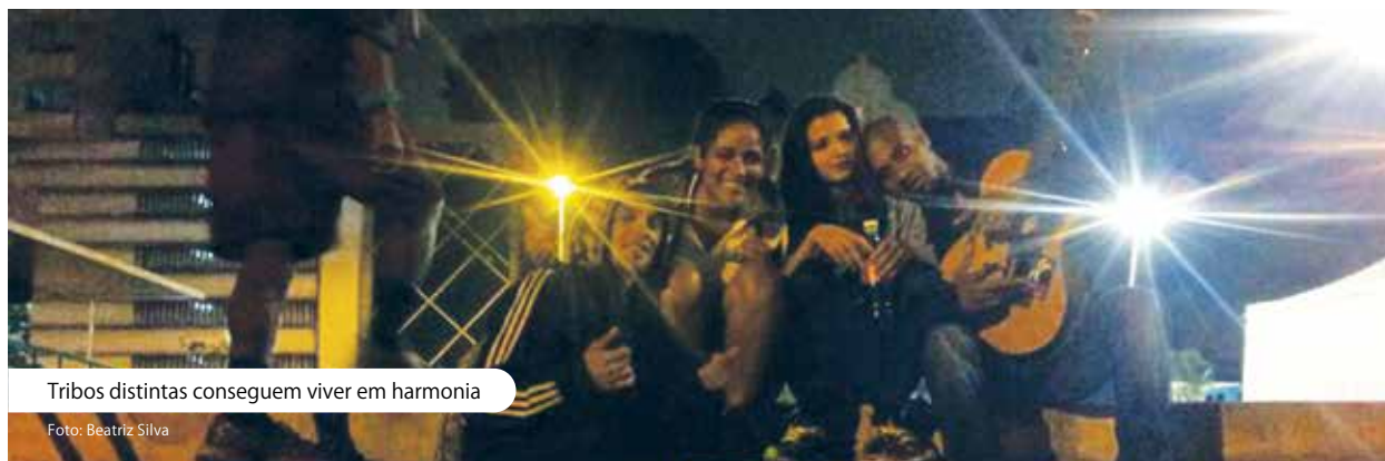
Tribos distintas conseguem viver em harmonia

“Um dos poucos lugares de São Paulo que ainda concentra estilos tão diferentes”