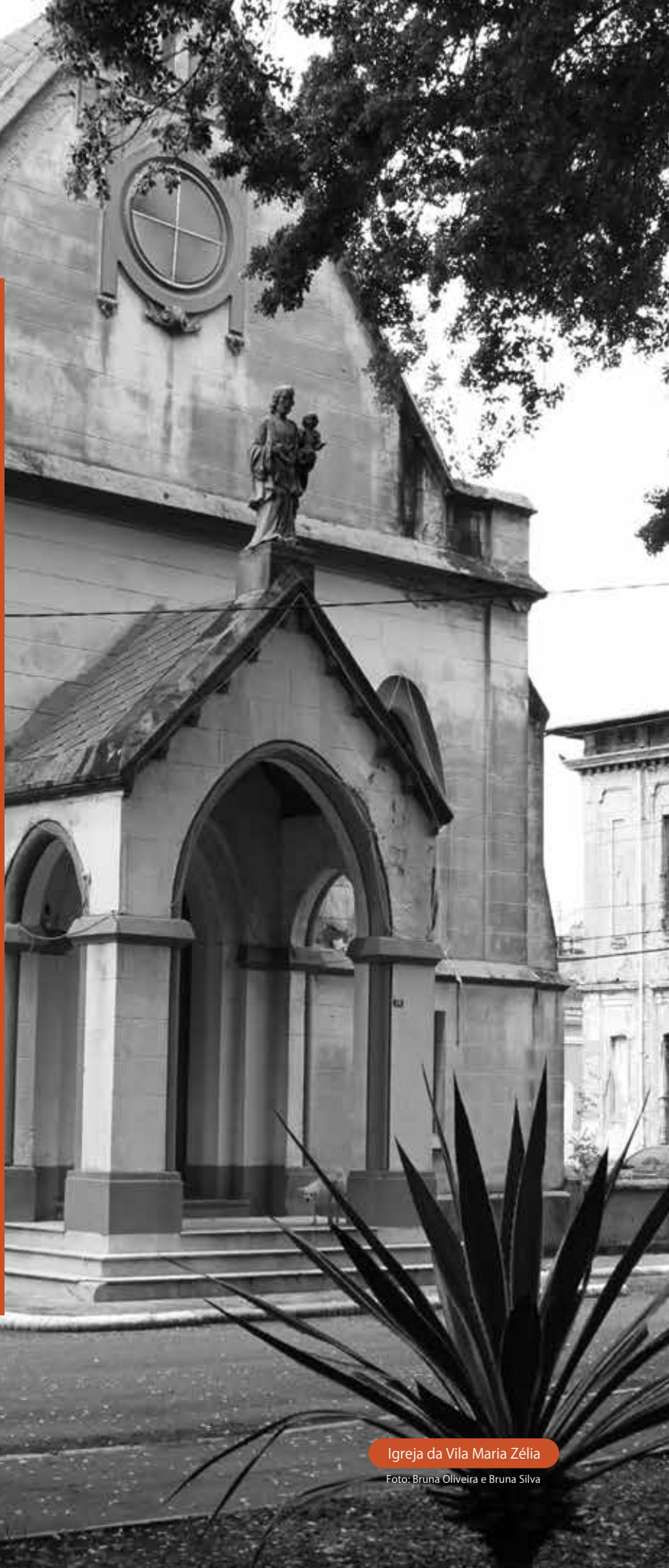
Igreja da Vila Maria Zélia

O valor arrecadado a partir dessas locações poderia ser utilizado para restauração das casas, se elas fossem de propriedade dos moradores. Tombada em 1992 pelo Condephaat (Conselho de Defesa do Patrimônio Histórico, Arqueológico, Artístico e Turístico do Estado de SP), a Vila recebe apenas uma doação simbólica como forma de agradecimento.