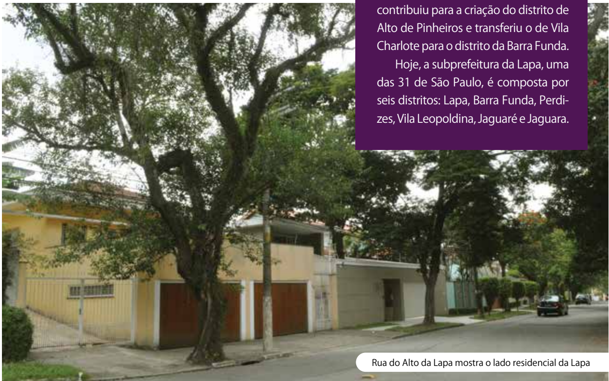
Rua do Alto da Lapa mostra o lado residencial da Lapa