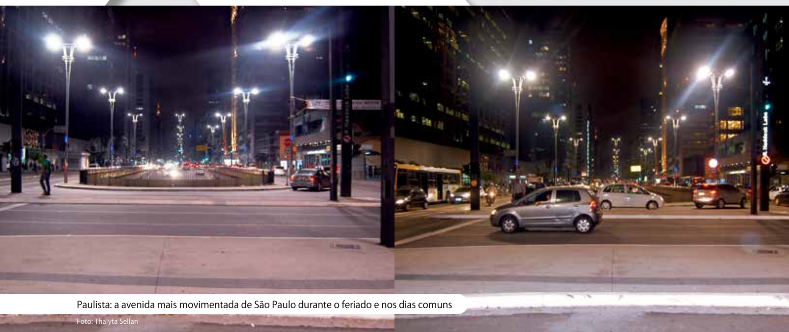
Paulista: a avenida mais movimentada de São Paulo durante o feriado e nos dias comuns

Nos feriados, mais de dois milhões de pessoas deixam a megalópole brasileira