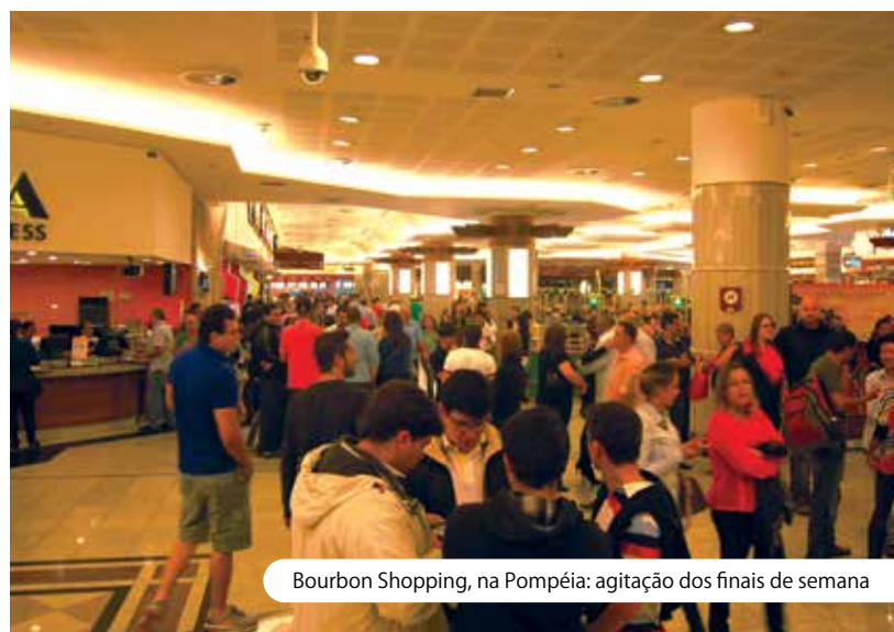
Bourbon Shopping, na Pompéia: agitação dos finais de semana